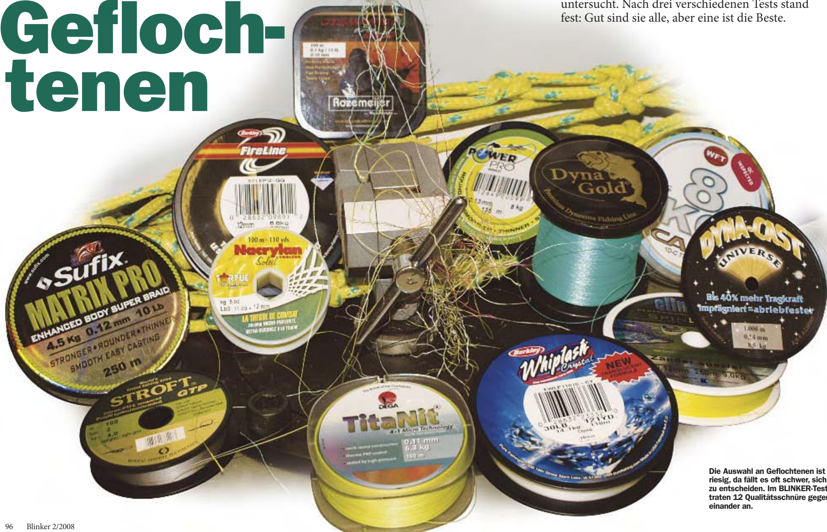
Die Auswahl an Geflochtenen ist riesig, da fällt es oft schwer, sich zu entscheiden. Im BLINKER-Test traten 12 Qualitätsschnüre gegeneinander an.